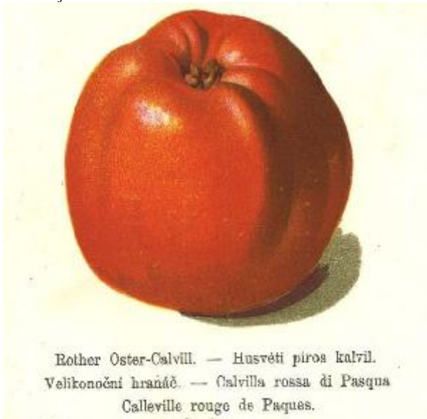
R. Stoll 1888 Pomologie. Assimilé à Rouge d'Hiver par Leroy.

FORME : Grosse, plus large ou L=H , conique , asymétrique , pentagonale donc pourtour bien côtelé.